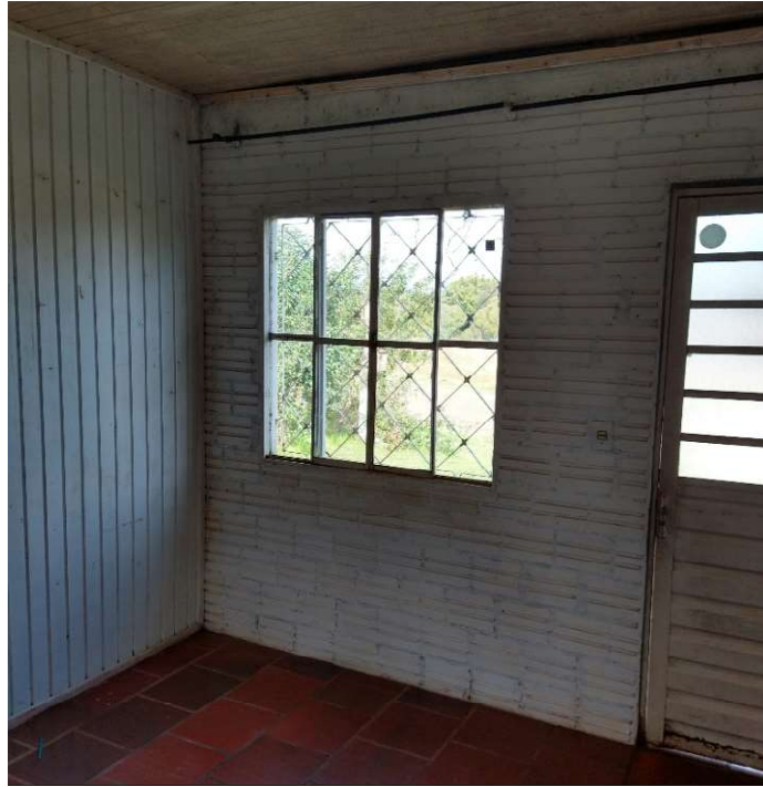
Edificação, conforme vistoria em 27 de junho de 2022