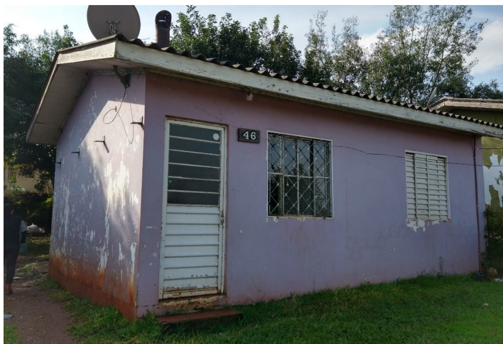
Edificação, conforme vistoria em 27 de junho de 2022